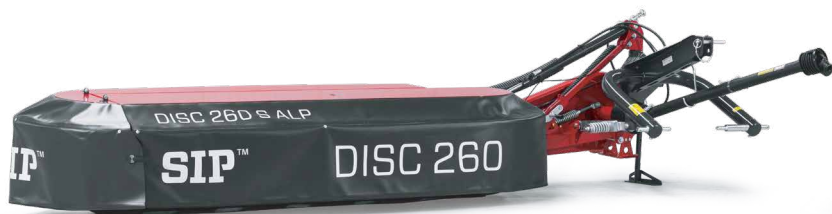
DISC 260 S ALP