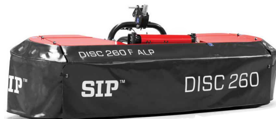
DISC 260 F ALP