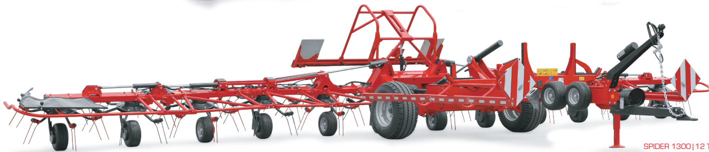
SPIDER 1300|12 T