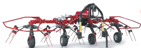
SPIDER 400|4 ALP